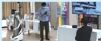
ロボット遠隔操作 実証実験

5G技術を活用した新たな製品・サービスの開発や社会実装に向けた各種検証が行えます。新潟市内の別の5G環境(万代シティパークなど)とも連携した実証も可能です。