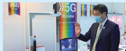
にいがたBIZ EXPO 2021 特別企画展「5G」

5G環境を生かした展示会や産業見本市など、来場者に製品やサービス、技術力などをPRする場として活用できます。