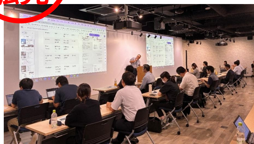
勉強会等イベントの開催