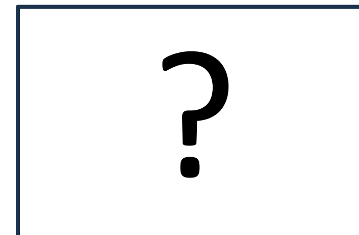
会員持込企画の開催