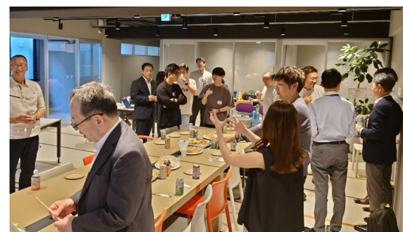
交流イベントの開催